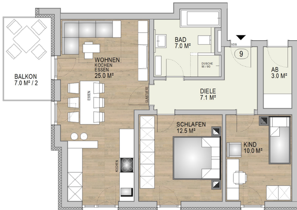
ÜBERSICHT 1. OBERGESCHOSS