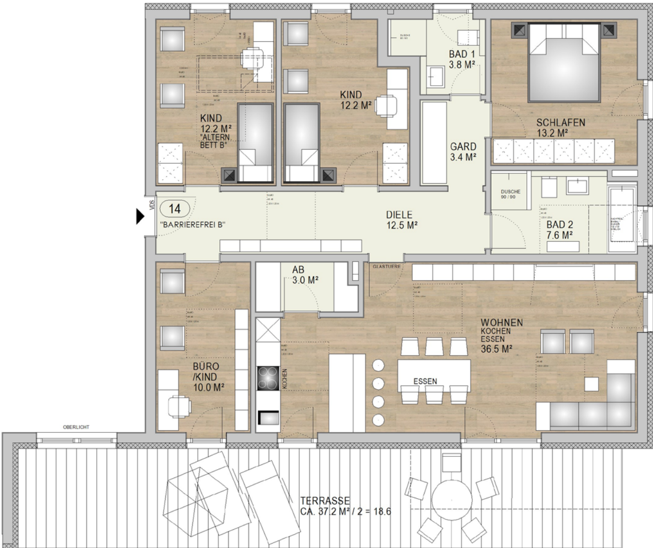
ÜBERSICHT 2. OBERGESCHOSS