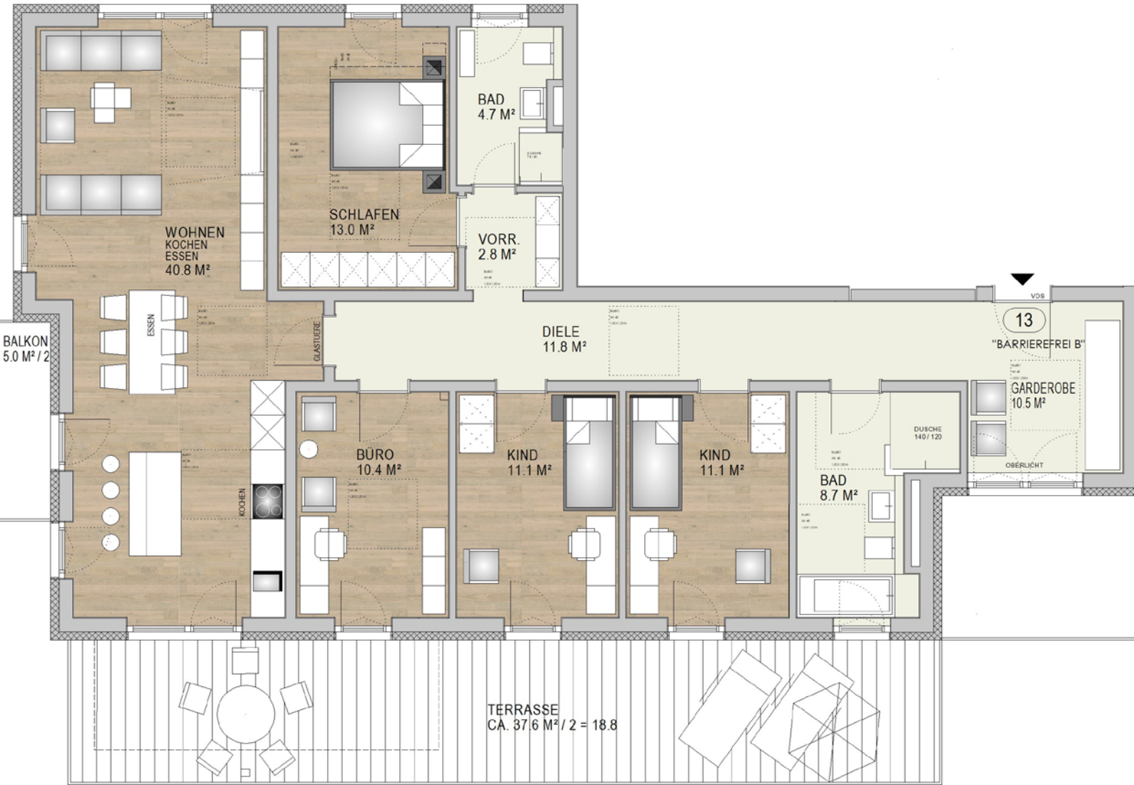
ÜBERSICHT 2. OBERGESCHOSS